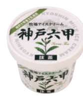
■ 牧場アイスクリーム神戸六甲 抹茶 ■ 120ml ■ アイスクリーム ■ 24 (φ73×58) ■ 乳13.0% 無10.6% 卵0.9%