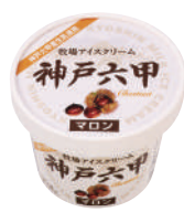
■ 牧場アイスクリーム神戸六甲 マロン ■ 120ml ■ アイスクリーム ■ 24 (φ73×58) ■ 乳10.0% 無12.5%