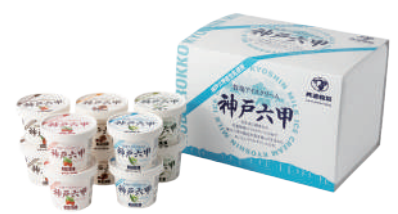
■ 牧場アイスクリーム神戸六甲 ギフト (10ケセット) ■ 120ml x 10ヶ ■ アイスクリーム ■ 180x250x170