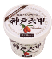
■ 牧場アイスクリーム神戸六甲 チョコレート ■ 120ml ■ アイスクリーム ■ 24 (φ73×58) ■ 乳12.5% 無9.7% 卵0.9%