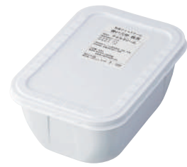
■ 牧場アイスクリーム神戸六甲 抹茶 ■ 2000ml ■ アイスクリーム ■ 4 (156×233×92) ■ 乳13.0% 無10.6% 卵0.9%