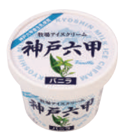
■ 牧場アイスクリーム神戸六甲 パニラ ■ 120ml ■ アイスクリーム ■ 24 (φ73×58) ■ 乳15.0% 無10.0% 卵0.9%

「五つ星ひょうご」とは・・・ひょうご五国 (摂津・播磨・但馬・丹波・淡路) の豊かな自然や歴史・文化を生かした商品のうち、“地域らしさ”に加えて、これまでにない新規性やオリジナリティなどの“創意工夫”が施された逸品を、統一ブランド名「五つ星ひょうご」として全国に発信するものです。