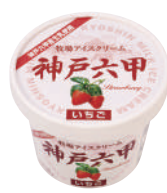
■ 牧場アイスクリーム神戸六甲 いちご ■ 120ml ■ アイスクリーム ■ 24 (φ73×58) ■ 乳13.0% 無11.3% 卵0.5%